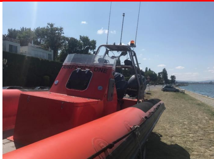
Bateau de patrouille navigant pour garantir la distance de sécurité de 150m

La pêche, la baignade, la plongée ou toute activité nautique dans le périmètre ne sont autorisés qu'à plus de 150 mètres du bateau tractant les canons à air.